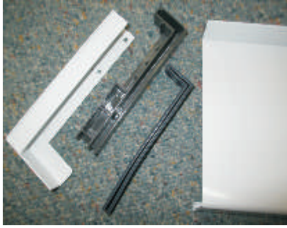
3 - teilig